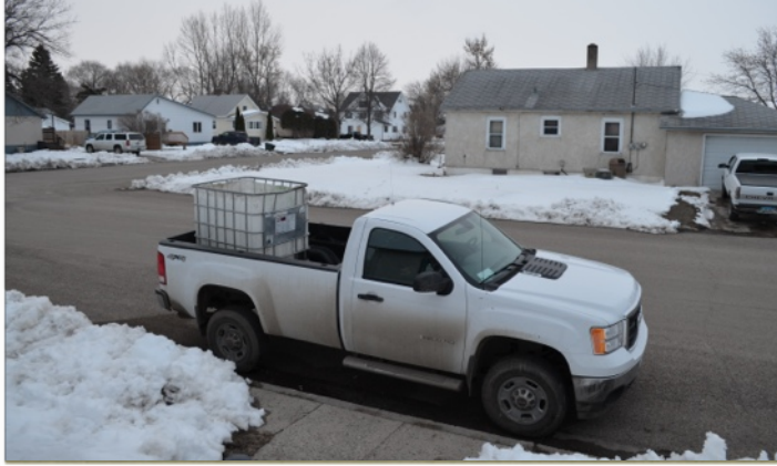
Arbejdsbil, som også må frit bruges til private ture

Vi har vores hver vores bil, fint lille hus med alt hvad vi har brug for, super internet (kæmpe bonus). Jeg blev sendt ned i en butik hvor jeg frit kunne købe alt det arbejdstøj jeg synes jeg havde brug for. Den første dag på arbejdet var lidt hektisk, da det lige passede med at vi havde kursus med nogle fra John deere, som skulle lære os om deres GPS system. Heldigvis kendte jeg det hjemmefra så det var ikke så svært. Men jeg mødte alle på gården med det samme, og vi er næsten 20 ansat her. Endelig begyndte der et komme lidt ro på, vi brugte et par dage på at køre rundt og kigge, lærer mig om de forskellige steder, stille og roligt forberede mig på de forskellige opgaver der skulle komme.